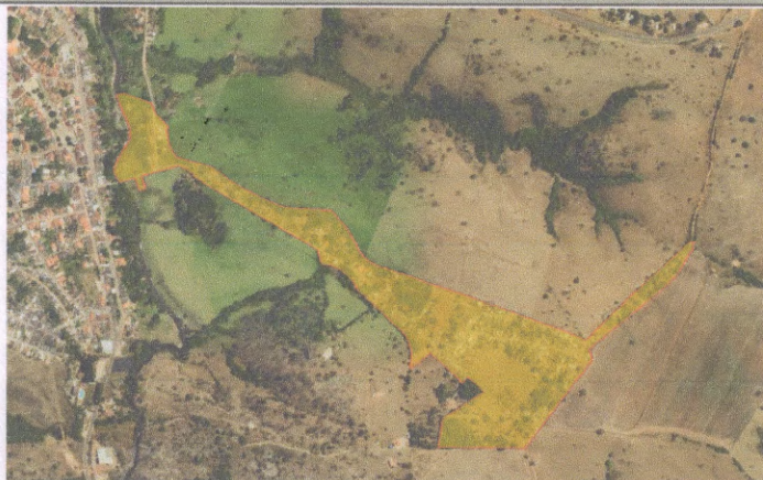
Figura 1 – Croqui da área

Área objeto de regularização: imóvel denominado “Gleba 3” e ETE, matrículas nºs 9.234 e 3.357 que se encontram no cartório de registro de Imóveis da Comarca de Corumbá de Goiás – GO, este núcleo urbano informal (NUI) é predominante de famílias de baixa renda, que foi denominado Bairro Alto Corumbá. O imóvel será objeto de Regularização Fundiária Urbana (Reurb) da Lei Federal nº 13.465 de 11 de julho de 2017.